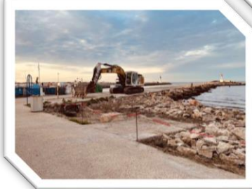
Môles du Grau-du-Roi