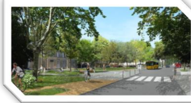
Eglise de Saint-Laurent d'Aigouze