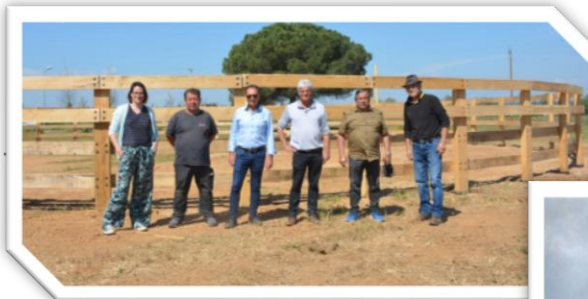
Parc public autour des cultures camarguaises à Aubord