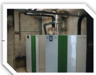
Chaufferie bois du gymnase de Lunel-Viel