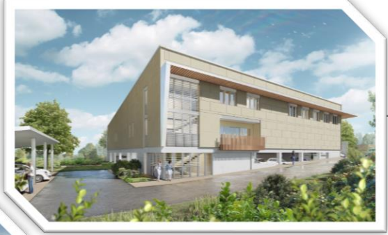
Cuisine centrale CC Petite Camargue